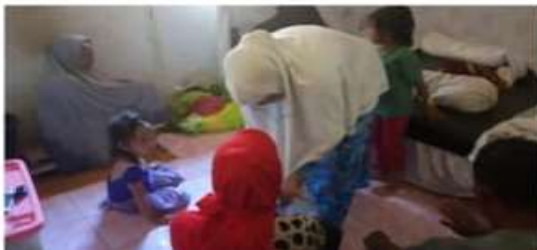
Gambar 5. Proses monothok bontho

Lebih lanjut, pada dokumentasi, peserta memotret beberapa aktivitas yang berhubungan dengan biaya pernikahan seperti para pemangku adat sementara mempersiapkan seserahan untuk mempelai wanita, pihak laki-laki sudah siap untuk membawa seserahan papa keluarga pihak perempuan, dan proses pembatalan air wudhu, sebagai tanda telah sahnya kedua mempelai dalam ikatan agama.