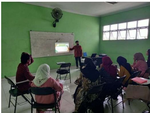
Gambar 3. Pemaparan materi

merupakan sumber yang tidak langsung memberikan data kepada pengumpul data, misalnya lewat dokumen (Burhan, 2012; Creswell, 2014; Djamal, 2015; Moleong, 2015).