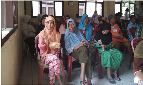
Gambar 2. Kegiatan pengabdian diikuti oleh lansia di Panti Jompo Tresna Werdha Natar