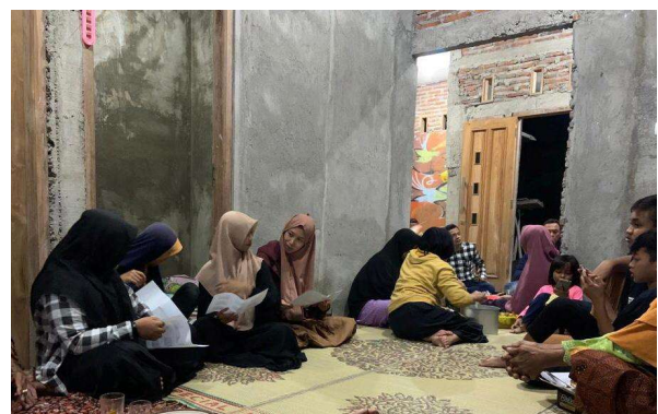
Gambar 1. Pembagian Soal Pre Test

menunjukkan bahwa materi yang diberikan dapat meningkatkan pemahaman peserta tentang keuangan Syariah.